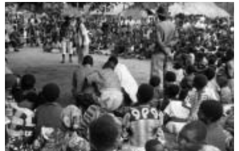
「エイズTOTOクラブ」のパフォーマンス。ユーモラスな歌や劇でHIV/エイズについての正しい知識を伝えている。非常に人気があり、村中の人びとが夢中で見入っている

特に、学校での活動は全国的に活発で、小学校の84%がエイズ教育を強化するための『エイズTOTOクラブ』を設置しています。『エイズTOTOクラブ』は、子どもたちが主体的に活動しているグループで、演劇や歌を通して、同世代の若者やコミュニティの人たちに、HIV/エイズについての正しい知識を伝えています。このパフォーマンスはとても好評で、毎回たくさんの人が見に来ます。身近で行われるこうした機会を活用してHIV/エイズを理解してもらい、正しい知識を広げ、偏見や差別を減らしていくことがねらいです。