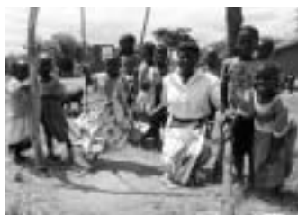
コミュニティの中につくられた孤児たちの保育園

エイズが原因で孤児となった子どもたちがきびしい状況に陥った時、子どもたちを守る大きな役割を果たしているのは、「コミュニティ(同じ地域に住む人びとや、同じ部族の人びと)」です。