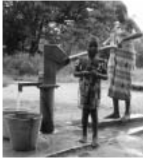
家族のために水くみをする女の子

人口1,260万人のマラウイで、HIV/エイズによって一方もしくは両方の親を失った子ども(0歳~17歳)は推定55万人にのぼっています。親をエイズで失った年長の子どもには、「家族を守って生きていく」という大きな重荷がのしかかります。同じようにエイズを発症した家族を看病したり、幼いきょうだいの世話や家事をしながら、生きるために働かなくてはならず、多くの子どもたちが学校をやめざる