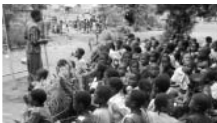
たびたび食糧難に陥るため、保護者たちが協力して、交代で学校で給食をつくって提供している。給食の成果で学校に通う子どもが増えた。教室が足りず、校舎の外で学習する子どもたち

ユニセフは、村長や、部族の長老といったコミュニティのリーダーたちに、HIV/エイズという病気について正しい知識を持ってもらう活動を支援しています。リーダーたちが積極的に対策に取り組むコミュニティでは、子どもたちは偏見や差別がない環境で、人びとに守られ安心して生活することができます。ユニセフは、子どもを守るためのコミュニティの主体的な活動も支援しています。